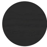
Frassino Nero Black Ash