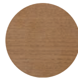
Frassino Tinto Noce Ash Stained Walnut